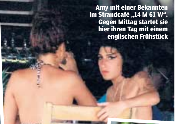
Amy mit einer Bekannten im Strandcafé „14 N 61 W“. Gegen Mittag startet sie hier ihren Tag mit einem englischen Frühstück

zeigen Gleichmut, die älteren Gäste Mitleid, die der jungen Amerikanerinnen am Nebentisch Verachtung. Amys Tagesablauf ist eigentlich immer der gleiche: Nach dem Frühstück tollt sie mit Kindern und Inselhunden herum, kauft Pizza für alle, hängt am Strand ab. Abends und Nachts geht es in eine der Strandbars, darunter auch die ihres neuen Heimorts „Cotton Bay“. Dort läuft es wie in einem Dorf. Jeder kennt sich vom Strandrestaurant oder vom Pool, nach ein paar Tagen grüßt man sich. Die Gäste wohnen in Kolonial-Villen, Amy im „Winward Close“, zahlt für sich und ihre Crew 5400 Euro pro Tag. Ein Hummer parkt direkt davor, keine Paparazzi lauern, wie sonst vor ihrem Haus in London. Fotografen dürfen sich dem Anwesen nicht nähern. Es ist später Nachmittag, ich gehe den weißen Strand entlang und sehe schon von weitem, wie Amy mit Kindern und Hunden herumläuft. Sie wirkt, als sei sie selbst erst 12 Jahre alt. Das Inselleben, so schreiben die britischen Zeitungen, sei ihre Rettung nach all den Drogenabstürzen und dem Liebes-Aus mit Blake. Ja, Amy wirkt glücklich, was nicht bedeutet, dass Amy plötzlich aufhört Amy zu sein. Erst vor Kurzem war sie auf St. Lucia in einem Club betrunken auf dem Bo-